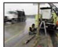
Panneaux de signalisation