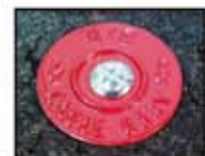
Macarons de repérage de réseaux enterrés